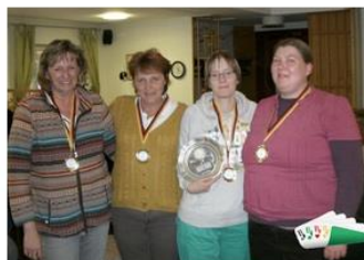
Herz As Neumünster